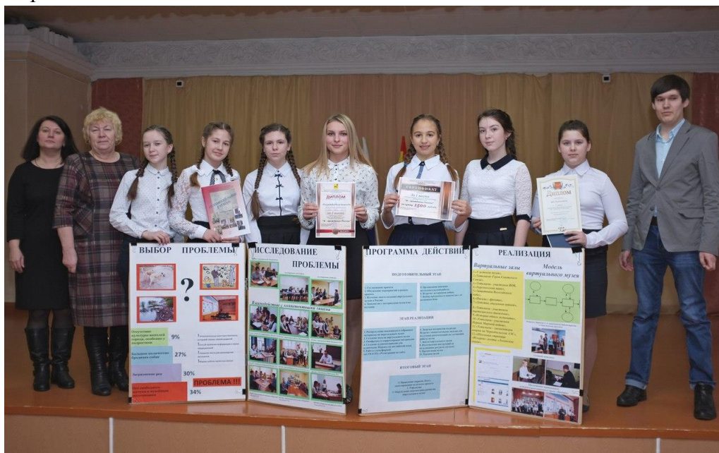
2016 год районный конкурс социальных проектов

2018 год социальный проект «Листая школьный альбом» занял 1 место в областном конкурсе проектов