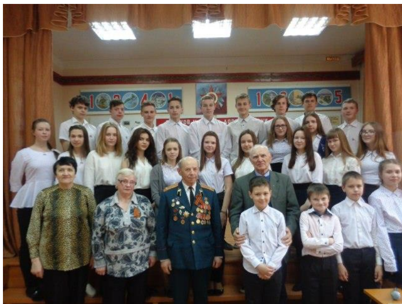
«Детство, опаленное войной» встреча с «детьми войны» 2017 год