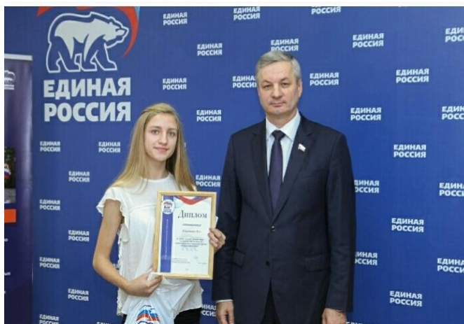
Вручение Диплома призера конкурса «Живая память»